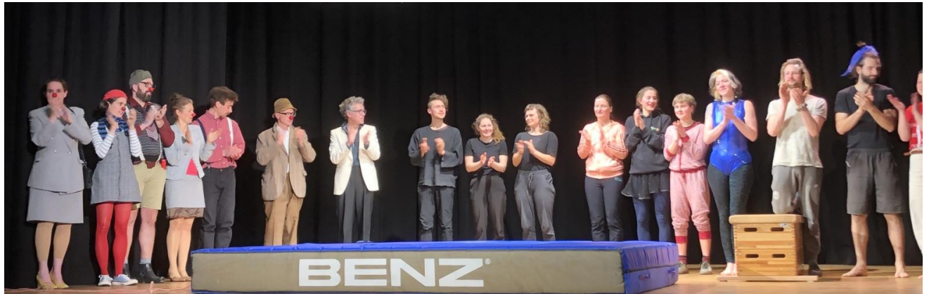
Offene Bühne in Freiburg

Das Jahr 2023 hat bei Jojo gut begonnen und wir freuen uns ganz besonders, dass die Clownaufbaufortbildung das erste Mal gestartet ist. Jetzt wünschen wir euch viel Spaß beim Lesen.