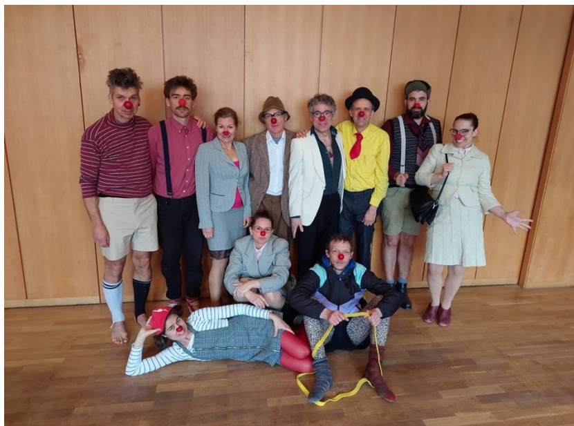
Clownaufbaufortbildung 2023 (eine Teilnehmerin fehlt auf dem Bild)