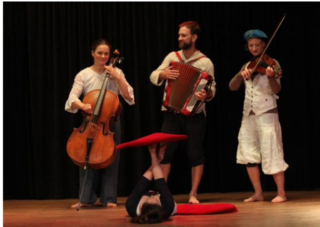
Impressionen aus "beziehungsweise" Abschlussstück A 5

Für die Inszenierungswoche der HG 5 vom 02. - 11.07. suchen wir noch eine*n Regieassistent*in. Ihr bekommt die Möglichkeit, Einblicke in die Regiearbeit der Dozent*innen zu bekommen. Der Abschluss der 2. Weiterbildungsjahres oder vergleichbare Vorkenntnisse sind Voraussetzung. Wir freuen uns auf Eure Bewerbung. Bewerbungen an: hamburg@jojo-zentrum.de