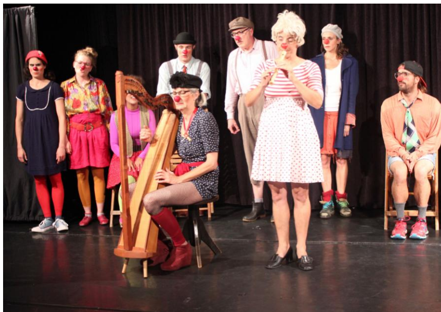
Impressionen aus einer früheren Clownfortbildung

Die komplette Ausschreibung mit Terminen, Preisen etc. findet ihr unter folgendem Link: www.jojo-zentrum.de/Clownfortbildung-HH-2021-2022-3.pdf