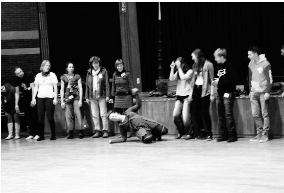
Momentaufnahme vom 20-jährigen Jubiläum von Jojo

https://www.jojo-zentrum.de/Programm-Jubilaum-2021.pdf